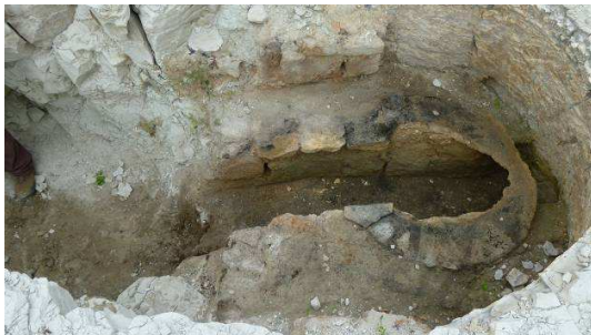
Figura 4. Horno de campanas.

El complejo arqueológico del yacimiento de La Poza se completa con una serie de hallazgos ciertamente singulares, como son la presencia de un horno de campanas, de época bajomedieval, claramente asociados al templo así como dos hornos destinados a cocer tejas. Se localizan todos ellos en las laderas del teso, sobre todo en el flanco suroriental, donde en superficie aflora una gran cantidad de tejas defectuosas, desechadas tras el proceso de cocción.