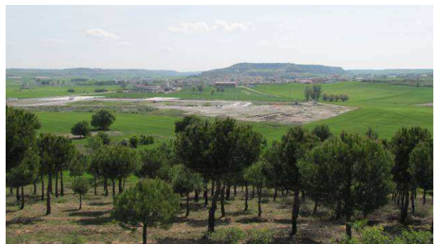
Figura 1. Vista general del entorno de Baltanás.