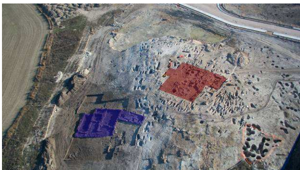
Figura 2. Foto aérea del yacimiento. En rojo la iglesia y en azul las viviendas

Tal y como hemos apuntado, la ocupación en el pago conocido popularmente como La Pozza se inaugura con la construcción de un pequeño templo de época hispano-visigoda cuya cronología ronda aproximadamente los siglos VI y VII d. C. Levantado en la cima de un pequeño cotarro que se eleva por encima de un bodón estacional, no debió de funcionar como parroquia hasta el siglo XI, momento en el cual se conforma buena parte del yacimiento arqueológico tal y como ha llegado hasta nosotros en la actualidad (MARTÍN, SAN GREGORIO, 2011: 80-89).