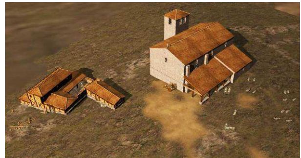
Figura 5. Reconstrucción virtual del conjunto.

Como en otras ocasiones en las que nos hemos enfrentado a la tarea de reconstruir estructuras prehistóricas de madera y barro, en ésta las dificultades a la hora de reconstruir virtualmente estas construcciones son diversas pero no insalvables.