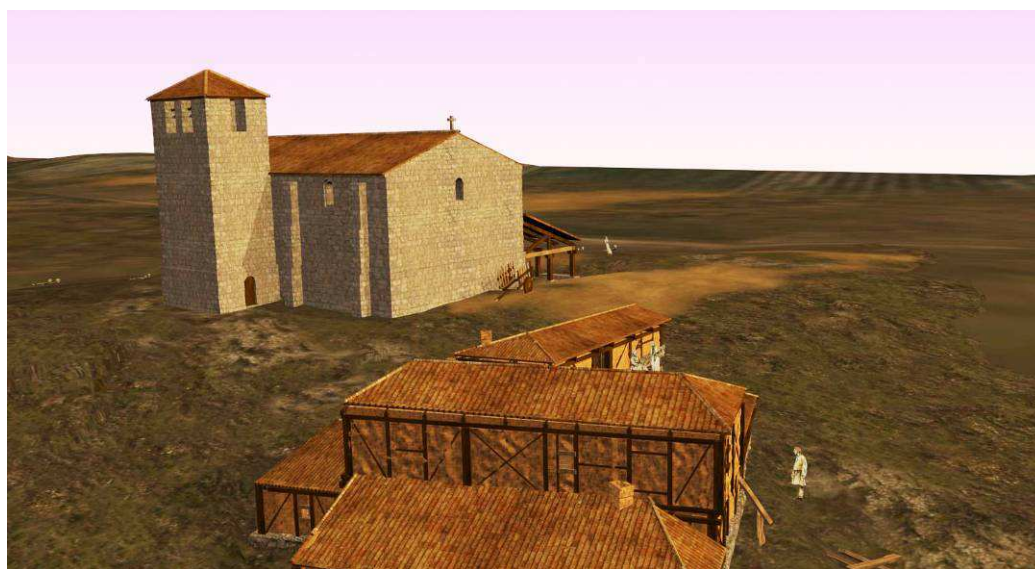
Figura 6. Arquitectura popular. Burgos